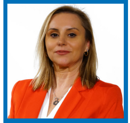
Prof.Dr. Dilek Teker

https://www.dunya.com/kose-yazisi/faiz-ve-doviz-gorunumu/698785